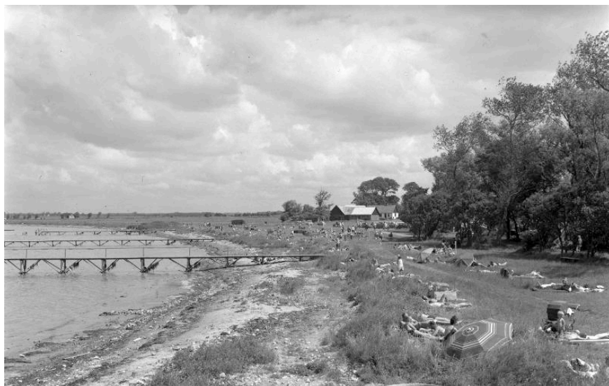
Ett par foton av senare datum. Här ser man fyra av bryggorna.