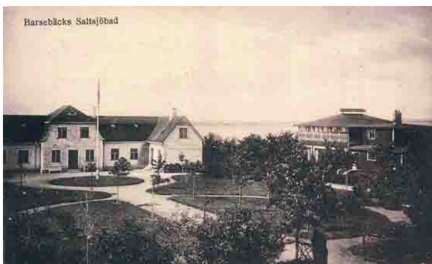
Foto taget med havet i bakgrunden. Framför Hotellet fanns en vacker trädgårdsanläggning. Restaurangbyggnaden till höger.