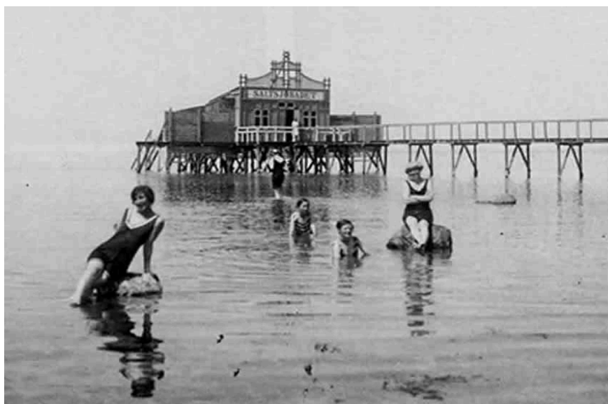
Stora bryggan med kallbadhuset

Längst ut på stora badbryggan fanns ett kallbadhus. För att gå ut dit fick man betala avgift.