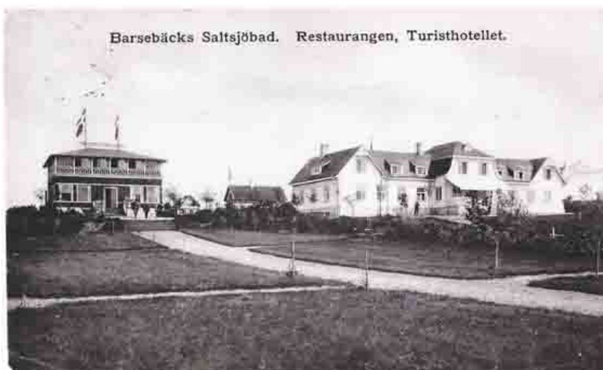
Restaurangen till vänster är borta sen många år och hotellet är numera både hotell och restaurang. Fotot taget från sjösidan.