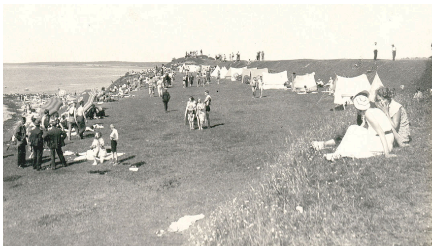
En bit av Stenbocks vallar till höger och på kullen längst bort byggdes under andra världskriget det fort som ännu finns kvar.