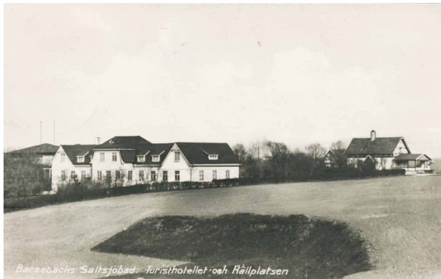
Hotellet från sjösidan med restaurangen till vänster och stationshuset till höger.

Järnvägen fortsatte köra badgäster till havet fram till 1954.