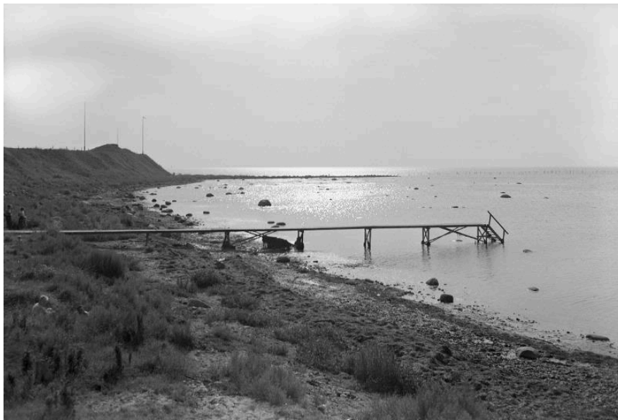
Ett stämmingsfullt foto med den södra bryggan och stenarmen i bakgrunden