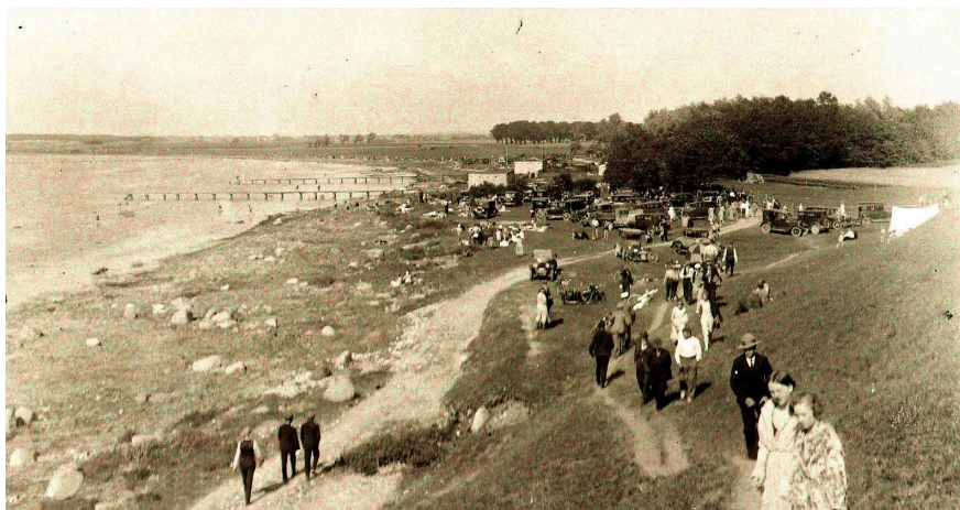
Ett mycket tidigt foto från Sjöbobadet