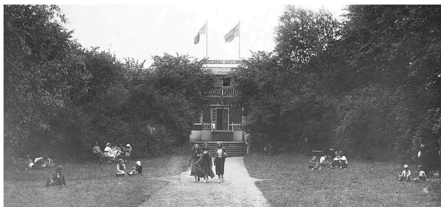
Det var väsentigt lummigare på den tiden