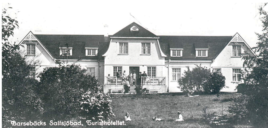
Hotellet mot havet