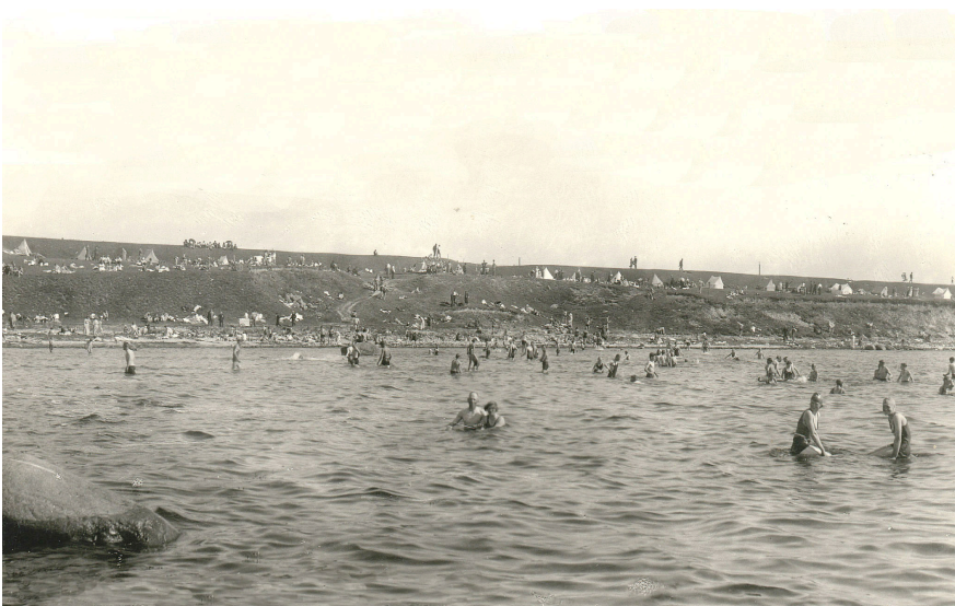
En bit av stenarmen till vänster i förgrunden och i bakgrunden backen med Stenbocksvallen högst upp. Massor med badande och tält för omklädning och skugga.