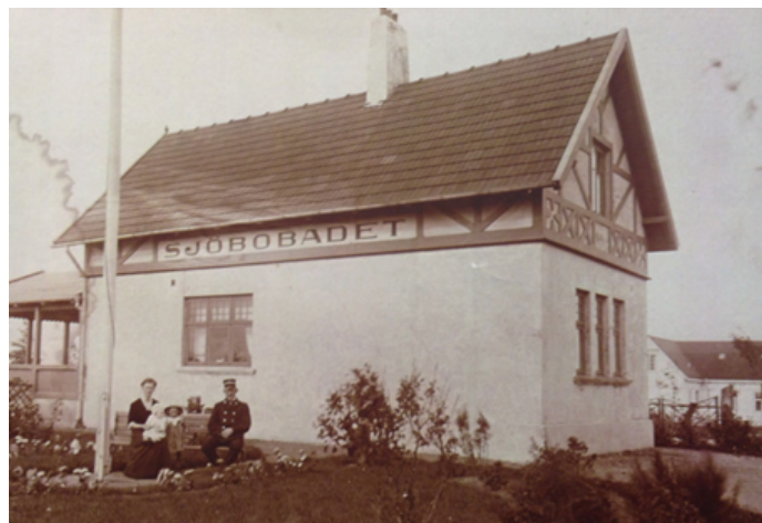
Banvaktshuset, som fick fungera som stationshus under badsäsongen, fotograferat från landsidan. I bakgrunden ses hotellet.

Stationshus och banvaktshus var det hus som, nästan helt dolt av grönska, ligger på andra sidan vägen mitt emot hotellet och numera är bostadshus.