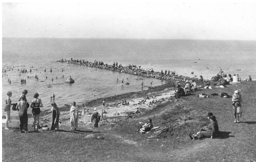
Förr sträckte sig badplatsen mycket längre söderut än idag. Fotona tagna vid stenarmen söder om nuvarande badplatsen. Man sade att man badade vid "vallarna" när man badade där. Det var fin sandstrand även där ända in på 1990-talet då en storm fyllde stranden med sten.